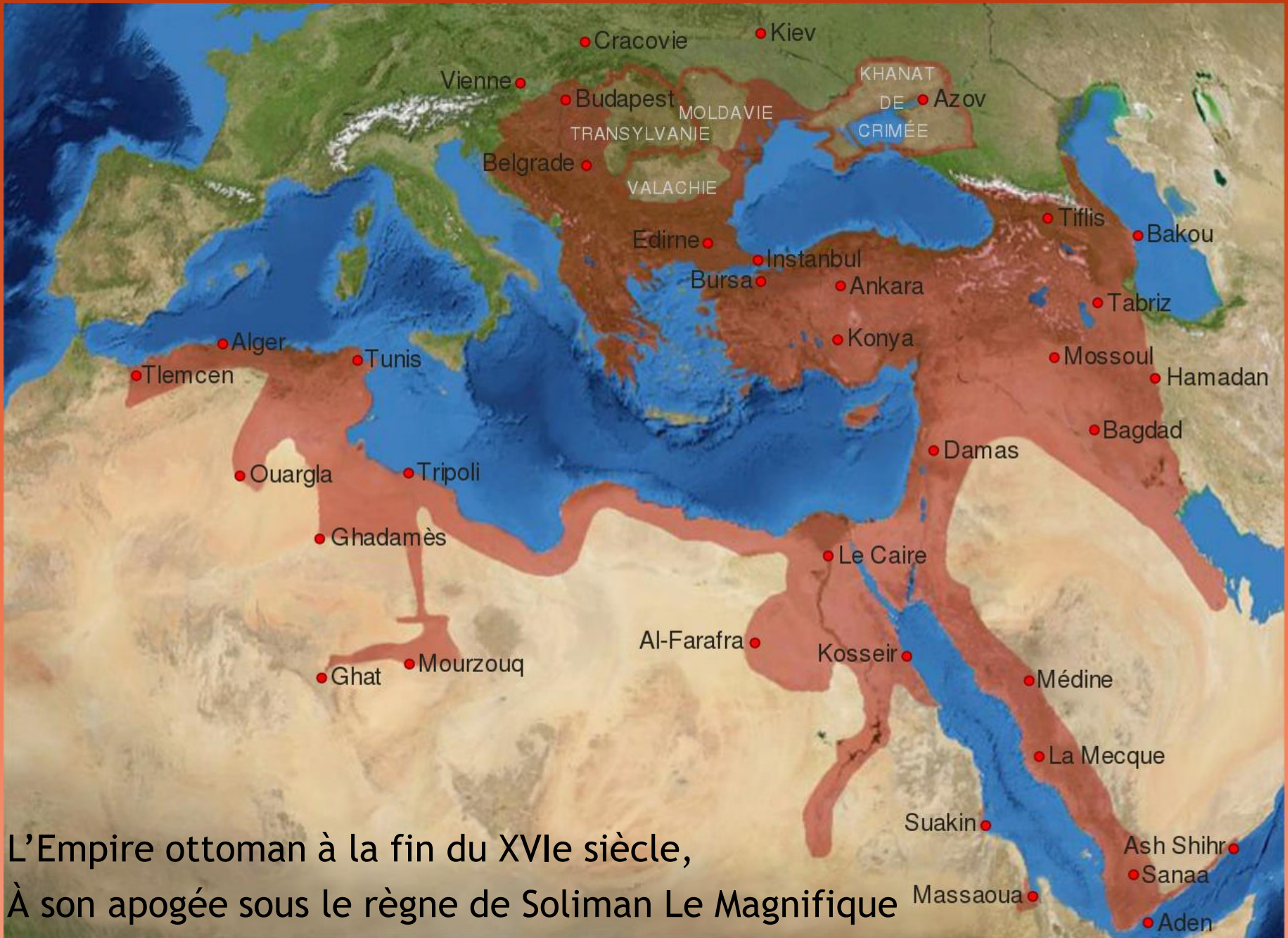
L'Empire ottoman à la fin du XVIe siècle, À son apogée sous le règne de Soliman Le Magnifique