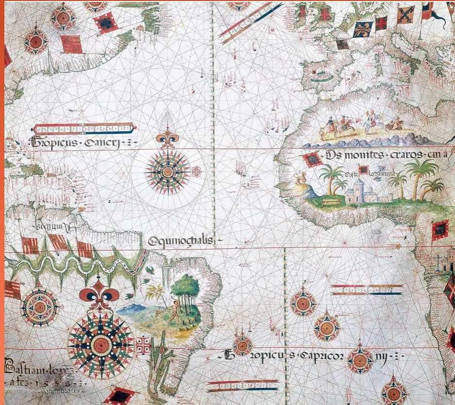
Carte de Sebastiao Lopez, Portugal, 1558 (British Library, Londres).

Cette carte du littoral atlantique de l'Europe, de l'Afrique et de l'Amérique montrent des drapeaux européens et des boussoles, pour marquer les différents pays et territoires du monde que les pays de l'Europe revendiquent.