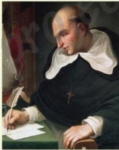
(Huile sur toile, anonyme, XVI e siècle, Séville, Espagne.)