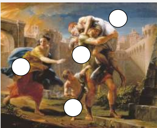
Pompeo Girolamo Batoni, Enée et sa famille fuyant la ville de Troie , XVIIIe siècle, huile sur toile, (Galleria Sabauda, Turin).

10 ans - 1er siècle avant J.-C. - le Cheval de Troie - les Grecs - guerre - Héra - Italie Junon - du Latium - la mer Méditerranée - mythe - six - Troie - Ulysse - Virgile